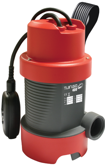
Twingo 400 Dirt 30 mm A